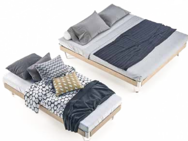
Fig. : 2020 vist i 90 cm samt 180 cm bredde med hvidlakerede ben.